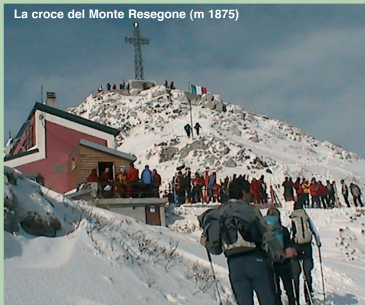
La croce del Monte Resegone (m 1875)

L'attuale nome di Resegone deriva dall'aspetto frastagliato del monte, che lo fa somigliare ad una sega ( resegga in dialetto lecchese). L'antico nome era invece