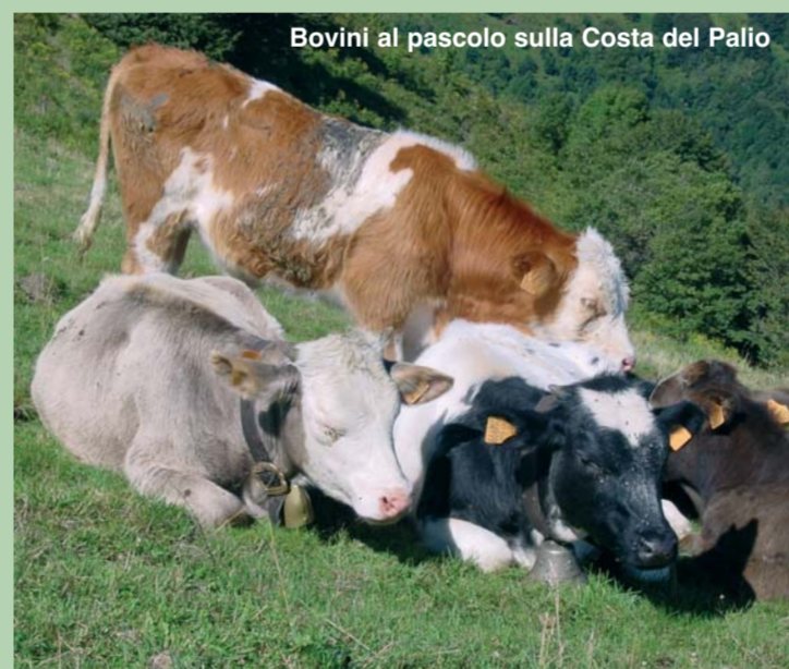
Bovini al pascolo sulla Costa del Palio

L'allevamento del bestiame ha sempre avuto un'importanza fondamentale per le popolazioni alpine; anche a